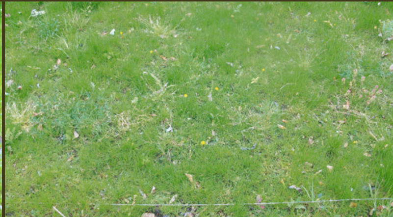
Traaggroeiend mengsel op bemeste grond, met opvallend meer onkruid.