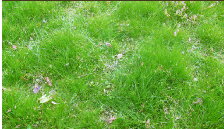
Snelgroeiend graszaadmengsel gezaaid op een bodem bemest met compost.

In 2008 vroeg Vlaco aan het Comité Jean Pain vzw om in het bezoekerscentrum Hof ter Winkelen in Londerzeel een aantal demonstratieproeven aan te leggen rond kringlooptuinieren. De proeven hebben een dubbel doel. Enerzijds nagaan in hoeverre bepaalde technieken inderdaad 'afval' beperken en tijd besparen; anderzijds hoe ze de tuin mooier en rijker maken. Inzake het thema 'grasbeheer' werden reeds volgende vaststellingen gedaan: