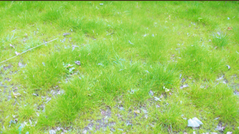
Een snelgroeiend graszaadmengsel gezaaid op onbemeste grond. Let op de gelere kleur van het gras.