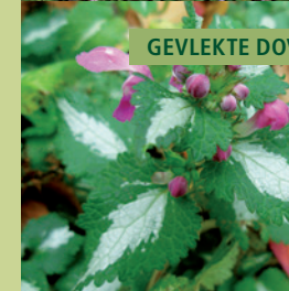
GEVLEKTE DOVENETEL | LAMIUM MACULATUM 'BEACON SILVER'

Goed groeiende bodembedekker met wintergroen blad en paarse bloemen.