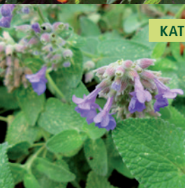
KATTENKRUID | NEPETA X FAASSENII 'SIX HILLS GIANT'

Langbloeiende plant met kenmerkende geur en blauwe bloem.