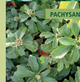
PACHYSANDRA | PACHYSANDRA TERMINALIS 'GREEN CARPET'

Bodembedekker met bescheiden, witte bloemtuitjes en glanzend blad.