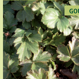
GOUDAARDBEI | WALDSTEINIA TERNATA

Wintergroene bodembedekker met gele bloemen. Vaak toegepast tussen buxusbollen.