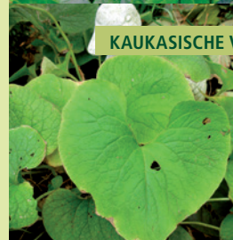
KAUKASISCHE VERGEET-MIJ-NIETJE | BRUNNERA MACROPHYLLA

Bodembedekker met hartvormige bladeren en kleine, blauwe bloemen op hoge stengels.