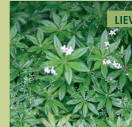
LIEVEVROUWEBEDSTRO | GALIAM ODORATUM

Schaduwinnende bosplant met welriekende, kleine bloempjes.