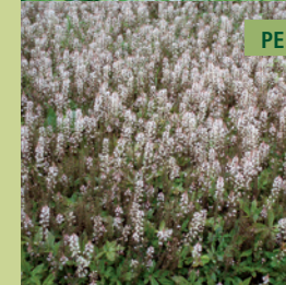
PERZISCHE MUTS | TIARELLA CORDIFOLIA

Krchtig groeiende bodembedekker met witte bloemaren. Het blad verkleurt in de herfst.