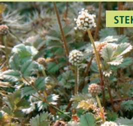
STEKELNOOTJE | ACAENA MICROPHYLLA

Wintergroene bodembedekker, onopvallende bloei, gevolgd door sierlijke, gestekelde vruchtjes.