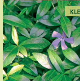
KLEINE MAAGDENPALM | VINCA MINOR

Wintergroene bodembedekker met paarse, blauwe of witte bloem.