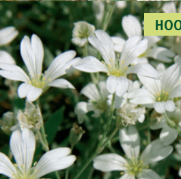
HOORNBLOEM | CERASTIUM TOMENTOSUM

Wintergroene, kruipende bodembedekker met witte bloempjes, ideaal voor droge hellingen.