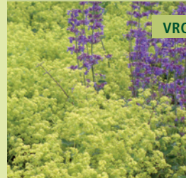
VROUWMANTEL | ALCHEMILLA MOLLIS

Zeer degelijke bodembedekker met gele bloemen en fluweelachtig blad.