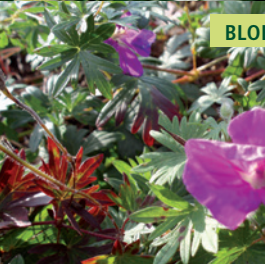
BLOEDOOIEVAARSBEK | GERANIUM SANGUINEUM

Sterkgroeiende, lage tuingeranium met roze bloemen en roodbruin, verkleurend herfstblad.